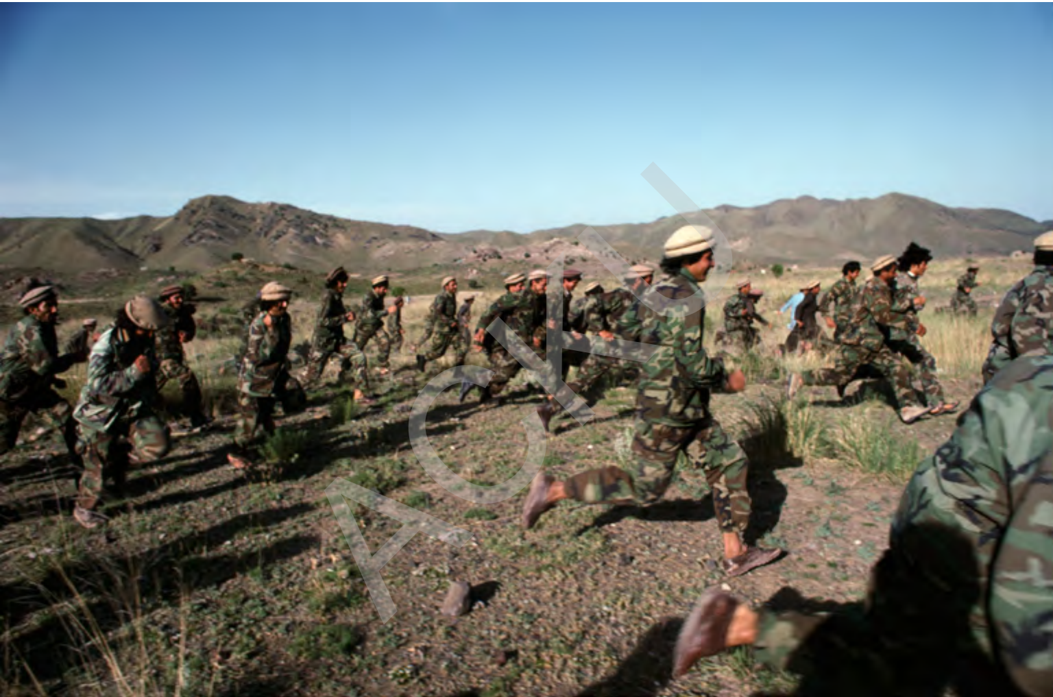
می ۱۹۹۰ مجاهدین افغان در یکی از کمپ های ژوار در بیرون از خوست مصروف آموزش اند.