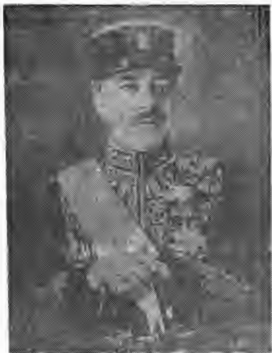
کیمورلتاشی وزیر دربار رضاشاه که در زندان شهربانی کشته شد