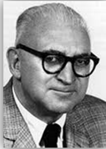
هارولد لاسول (۱۹۰۲-۱۹۷۸)