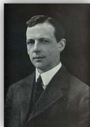
چارلز ادوارد مریام (۱۸۷۴-۱۹۵۳)

چارلز مریام ۸ و هارولد لاسول، دو تن از پدران روان‌شناسی سیاسی، بیش همه ایده‌های فروید را در مطالعه سیاست به کار گرفتند. مریام به عنوان استاد لاسول، نخستین تأثیر فکری را بر او داشت. اما چون لاسول آن ایده‌ها را به نگارش در آورد، اغلب لاسول را اولین روان‌شناس سیاسی آمریکایی و گاهی اوقات اولین روان‌شناس سیاسی می‌دانند. کتاب‌های «آسیب‌شناسی روانی و سیاست» ۹ و «قدرت و شخصیت» ۱۰ او که به ترتیب در سال‌های ۱۹۳۰ و ۱۹۴۸ منتشر شدند، آثاری شاخص در این زمینه بودند.