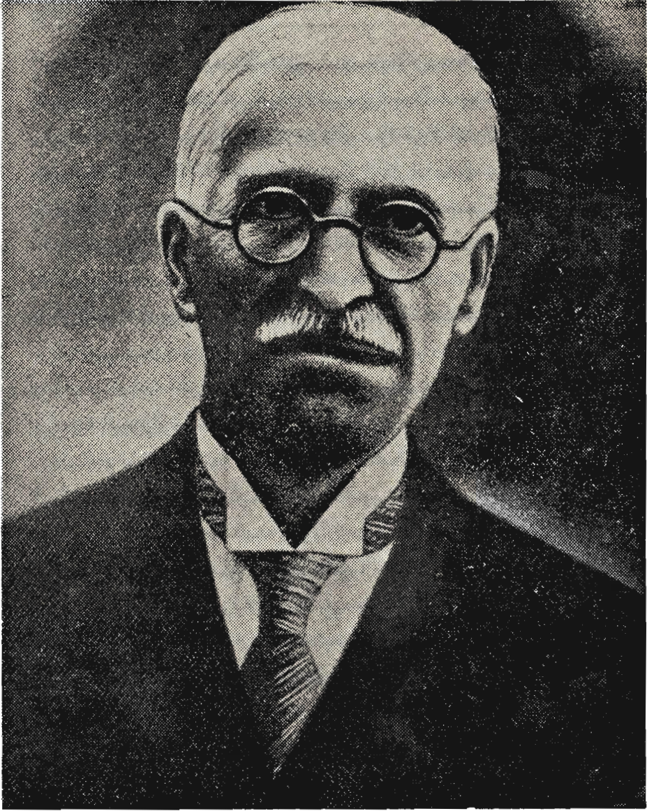
علامہ محمد قزوینی