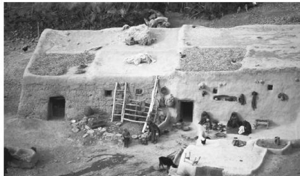
در جنوب و مرکز افغانستان، خانه‌ها بیشتر به شکل مزارع از جنس کاه و گل ساخته می‌شوند.

تقریباً کلیه اجناس تولیدی از خارج وارد این کشور می‌شود. سرمایه این کار از سوی پناهندگان و مهاجرین تأمین می‌گردد. کوتیون کامپویر علوم مردمی