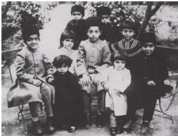
عکسی از دوران خردسالی صادق هدایت (ردیف جلو دوم از راست - با لباس سفید)

شرح اوضاع آن سالها در این جا نمی گنجد فقط اشاره می شود که در وضع جدید چند عامل مزید بر عواملی شده بودند که بیش از پیش از تاب زندگی او می کاستند. هدایت تا تابستان ۱۳۲۵ دست کم اطاقی داشت که در آن می توانست تا حدودی به آزادی در آن به سر برد. در آن اطاق خانه ای که برق نداشت و در زمستانها زمهریر و تابستانها آتشبار بود و به سخن یکی از آشنایانش تمام روز از آن سوی خیابان پرستگلاخش صدای گوشخراش از کارخانه ی سنگ کوبی و آهنگری می آمد، محکوم به زندگی شده بود. در نامه ای به رفیقش، حسن شهید نورایی، می نویسد: