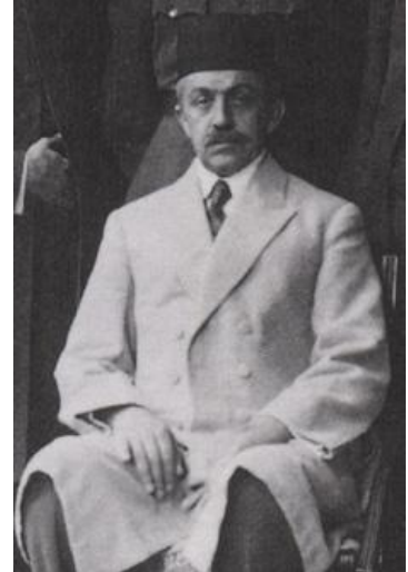
اعتمادالملک (پدر صادق هدایت)

در حدود سپتامبر ۱۹۲۶ وارد بلژیک می شود و بیست روزی در هتل سپلانید در پایتخت بلژیک اتراق می کند و از آن جا رهسپار شهر گان (گنت) می شود، در اکتبر ۱۹۲۶ نامش در دفتر اداره ی اتباع خارجه این شهر ثبت می گردد و در دهم اکتبر ۱۹۲۷ نامش را خط می زنند پس بایستی پیش از این تاریخ شهرگان را ترک کرده بوده باشد.