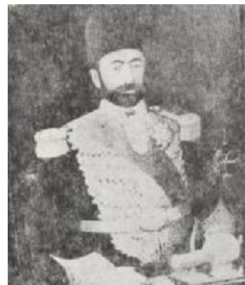
جعفر قلی خان هدایت (نیرالملک) - وزیر علوم ۱۲۷۵ شمسی

نیاکان صادق هدایت در دامغان میزیستند. محمد هادی نیای بزرگ صادق هدایت از نوکران آقا محمد خان قاجار بود. پس از درگذشت محمد هادی (۱۲۱۸ قمری) زنش با فرزندش رضا قلی نزد خانواده اش به بار فروش رفت.