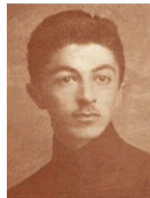
صادق هدایت در نوجوانی

بخواند و "تیترا" مهندسی بگیرد... یکی از علل ثانویه اقدام او به خودکشی در رود مارن رادر محجوریت مسوولان فرهنگی ایران و بی‌علاقگی و حسادت برادران بزرگترش به سرنوشت او باید جست.