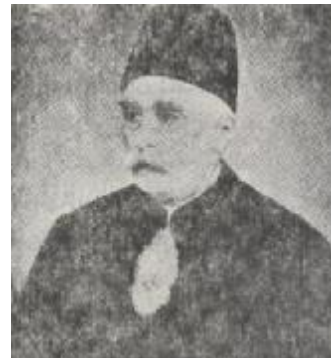
مهدی قلیخان هدایت (مخبرالدوله) - وزیر علوم ۱۲۵۵

از آن چه که درباره‌ی کودکی و نوجوانی او از خویشان و همدمانش شنیده یا خوانده ام، سه پیشامد را در این مقام درخور ثبت می‌دانم: