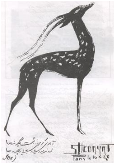
نقاشی زیبایی از صادق هدایت (طرح معروف آهوی او)

باری، هدایت با فروش کتاب‌ها و اثاثه و دریافت حقوق دو ماهه اش توانست عازم شود و به نوشته ی خودش به مباشر کارهای اداریش (نامه ۲۲ دسامبر ۱۹۵۰ به انجوی شیرازی) از "لجنزار گندیده" گریخت.