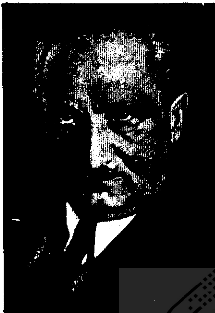
○ مارتین هایدگر