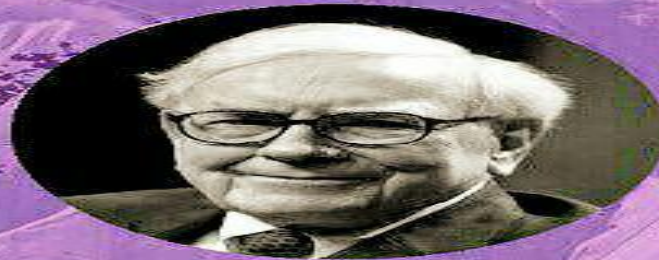
Warren Buffett CEO of Berkshire Hathaway

It takes 20 years to build a reputation and five minutes to ruin it. If you think about that, you'll do things differently.