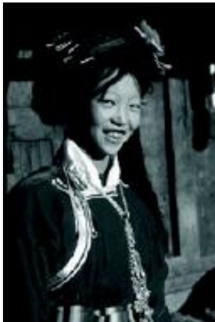
زن موسویی

حیاطِ داخلیِ خانه راه دارد و هم از طریقِ یک درِ خصوصی به کوچه. دخترِ موسویی در مورد اینکه چه کسی از طریقِ درِ خصوصی واردِ «باباهواگو» ۱ یا (اتاقِ گل) او شود از خودمختاریِ کامل برخوردار است. تنها قانونِ سرسختانه این است که مهمان او باید قبل از طلوعِ آفتاب از آنجا بیرون رفته باشد. دختر اجازه دارد در صورتِ تمایل، در شبِ بعد- یا در همان شب- معشوقِ متفاوتی داشته باشد و هیچ انتظاری برای تعهد وجود ندارد. هر بچه‌ای که در این بین به وجود آید، در خانه‌ی مادرِ این دختر بزرگ می‌شود، و در این دوران، برادرانِ دختر و سایر اعضای خانواده به دختر کمک می‌کنند.