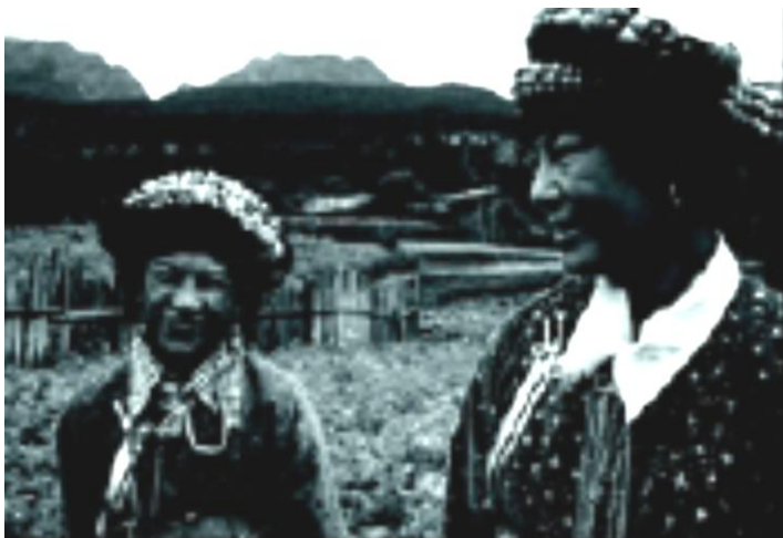
زنان موسوی

به ویژه، موسوی‌هایی که بیش از سایرین پرشور و حرارت هستند، بدون هیچ گونه احساسِ شرم از صدها تجربه‌ی جنسیِ خود سخن می‌گویند. شرم - از نگاهِ ایشان - شایسته‌ی موقعیت‌هایی است که کسی از دیگری درخواستِ وفاداری و تعهد می‌کند. درخواستِ وفاداری و تعهد، به عنوان عملی ناشایست و تلاشی برای معامله یا معاوضه نگریسته می‌شود.