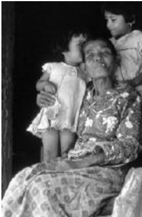
زنی از مینانگ کاباو به همراه دو دختر

نه رقیبانی که به دنبال منافع شخصی خودمحورانه هستند." و اینکه همانند گروه‌های اجتماعی بونوبوها، جایگاه زنان، با پا به سن گذاشتن و یا "ایجاد روابط مطلوب با دیگران افزایش می‌یابد. . . ." [۱۶]