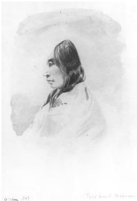
Field sketch by Paul Kane [5]

چندتایی از قبایل بومی آمریکا، که ساکن جلگه‌های بالایی بودند، زیبایی را در این می‌دیدند که تخته چوب کوچک را در بخش جلویی سر نوزادان که هنوز در حال رشد است قرار دهند. [۴] همانطور که بچه بزرگتر می‌شد، این تخته‌ها در حالت کشیده‌تری قرار می‌گرفت. همانطور که متخصص ارتدونسی به تدریج دندان‌ها را هم‌ردیف می‌کند. معلوم نیست که مغز در نتیجه‌ی این عمل صدمه می‌دیده است یا نه، اما این تغییر باعث می‌شده است تا سر، حالتی مخروطی و