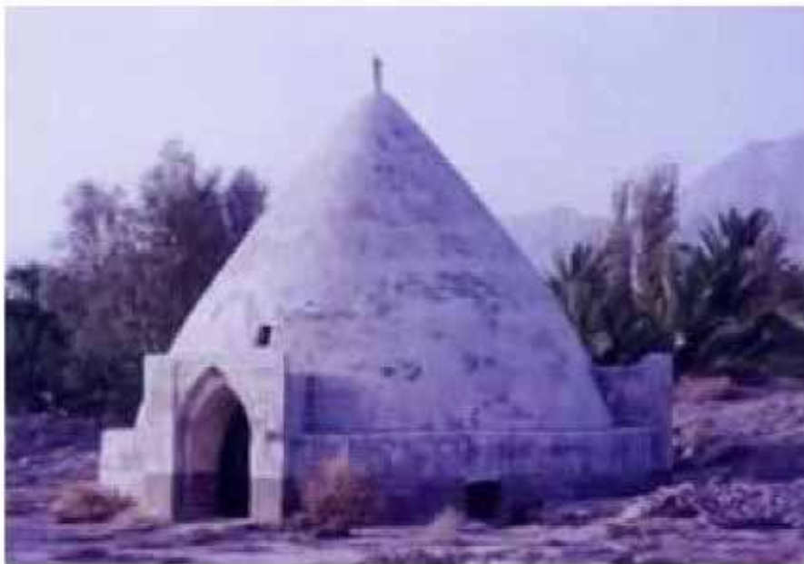
برکه حاج علی رضا (کل کادی) - بخش کوخرد