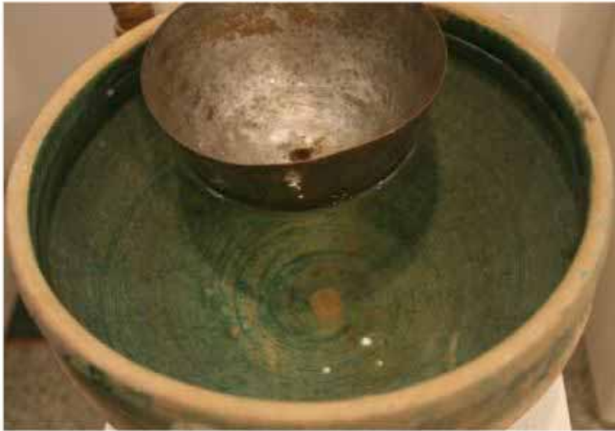
پنگ و پیاله