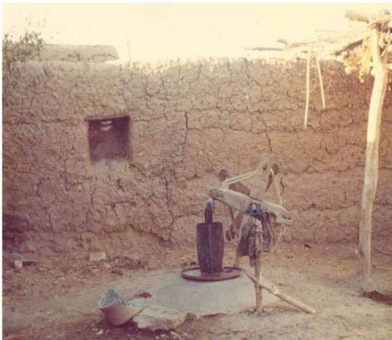
دلو و چرخ چاه آب در یک منزل مسکونی