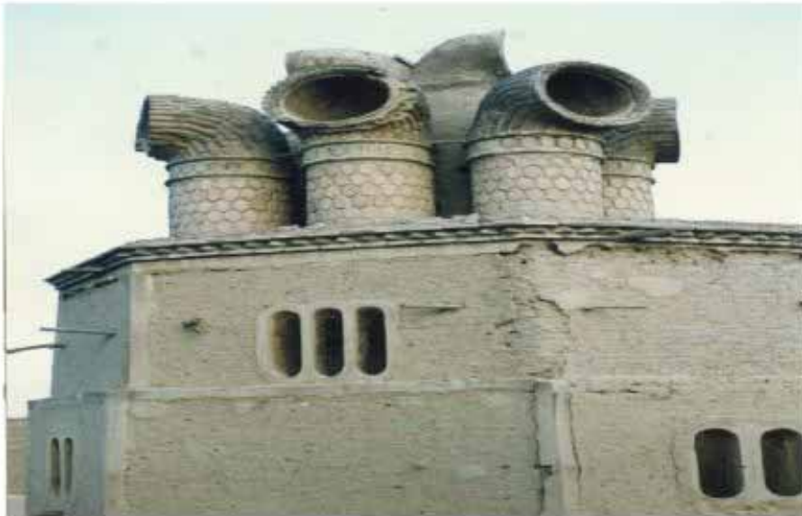
بادگیر آب انبار برای خنک نگهداشتن آب