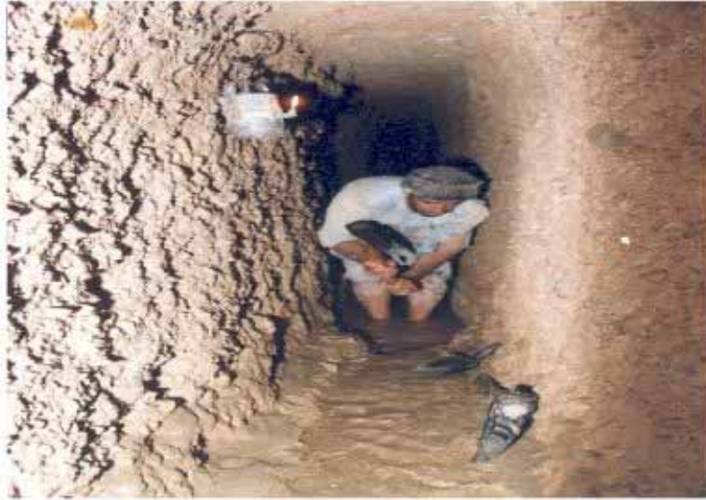
مقنی با ابزار حفر قنات