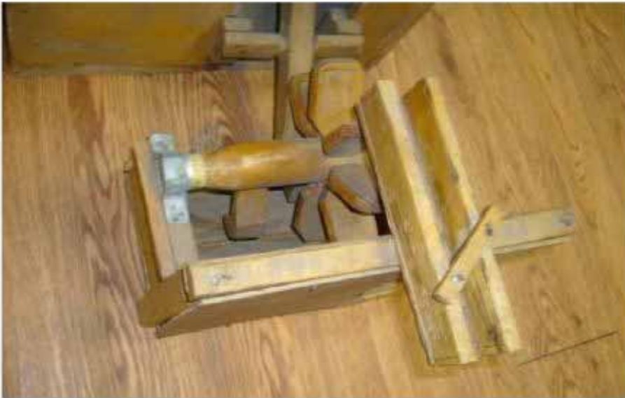
نمایی دیگر از آب دنگ