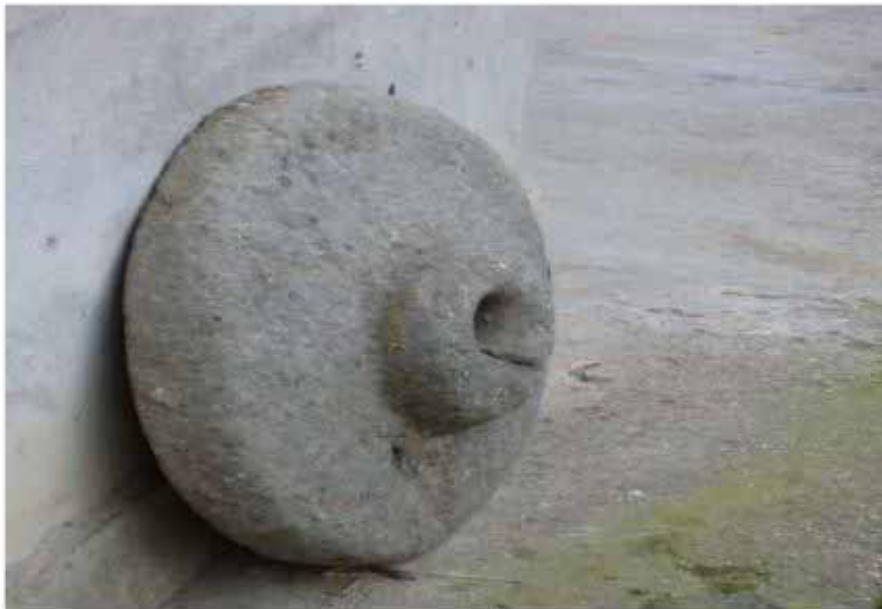
سنگ آسیاب قدیمی