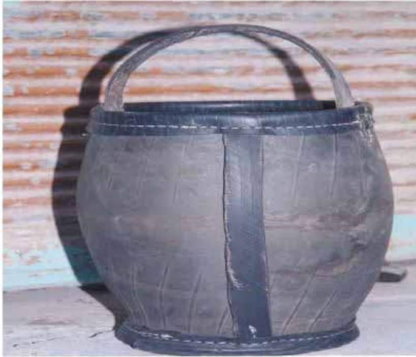
دَلُو یا دُول