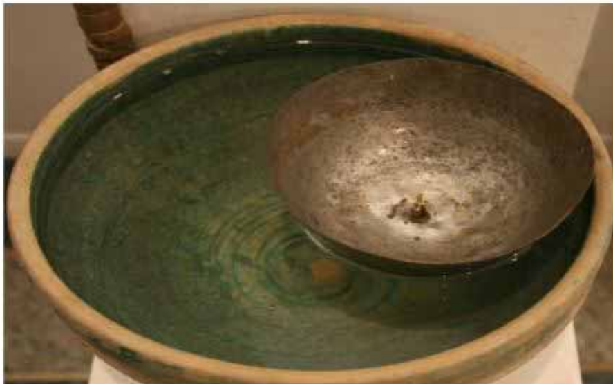
پنگ در حال فرو رفتن در پیاله