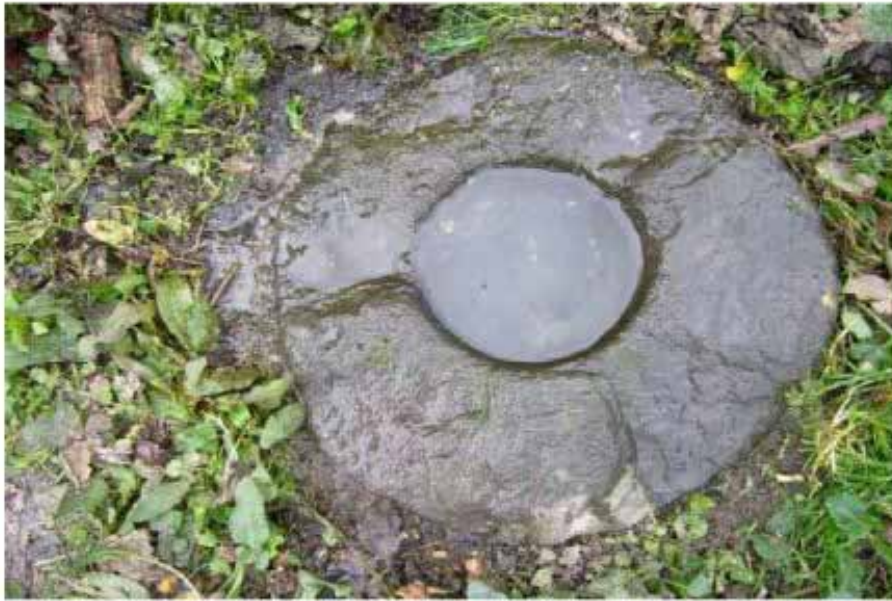
آب تقسیم کن سنگی