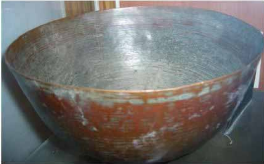
طشته با خطهای مدرج