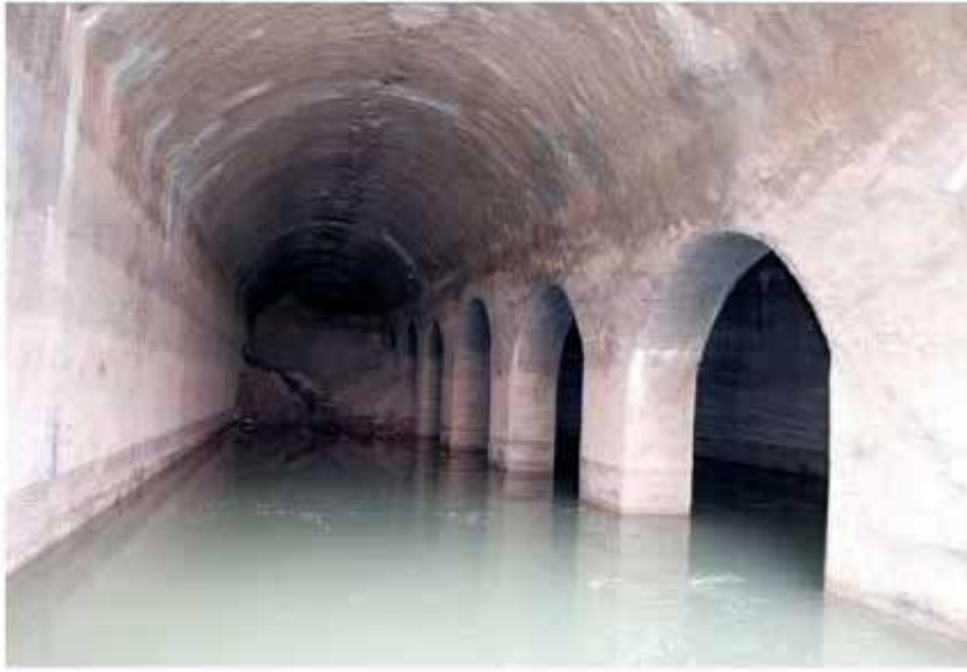
نمای درونی آب انبار