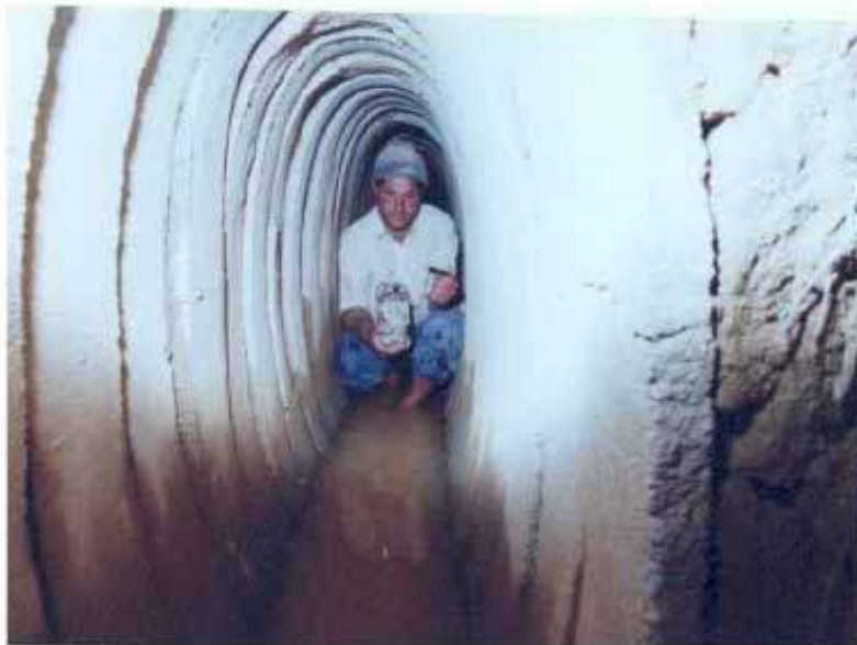
چاه گول بست و مقنی