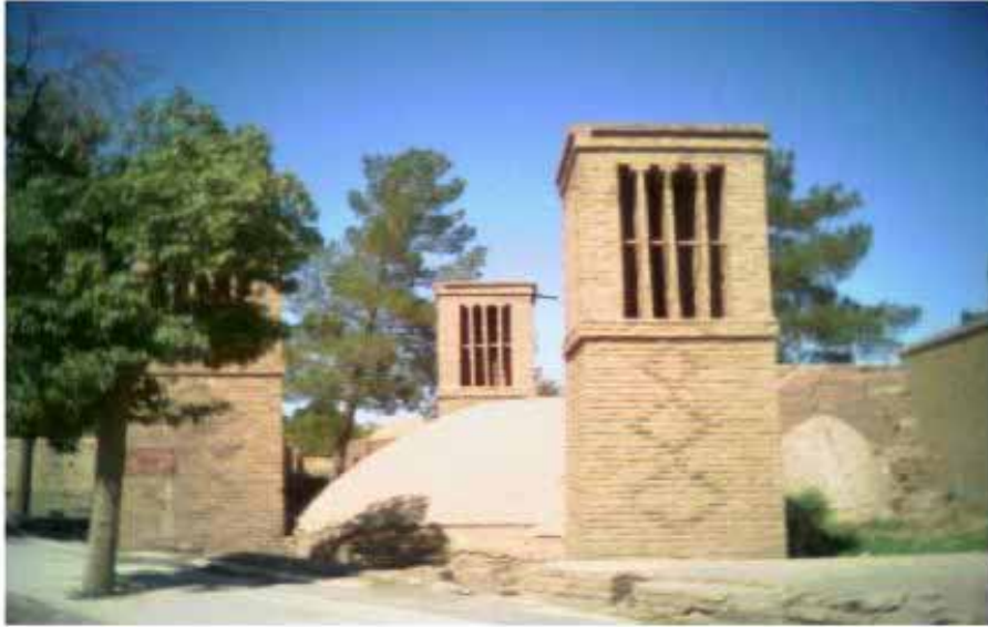
آب انبار با بادگیر