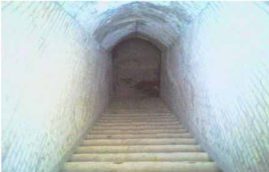
ورودی آب انبار