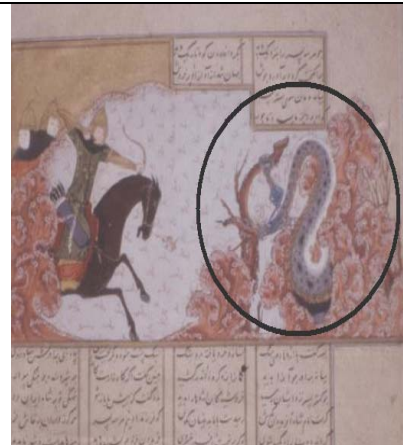
نگاره شماره ۹