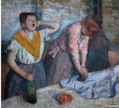
Édgar Degas - Les repasseuses

این تابلو، اثر ادگار دُگا (۱۸۳۴-۱۹۱۷)، بین سال‌های ۱۸۸۴ تا ۱۸۸۶ کشیده شده است. تابلو از نوع رنگ روغن و به ابعاد ۸۱×۷۶ سانتی‌متر است که در موزه اُرسی ۱ پاریس نگهداری می‌شود.