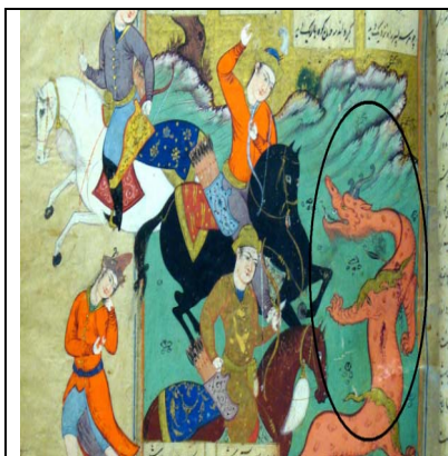
نگاره شماره ۶