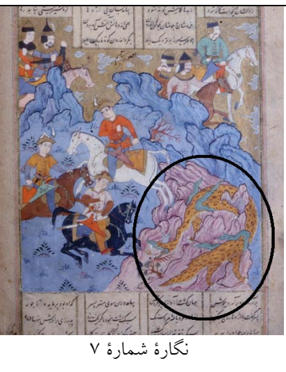
نگاره شماره ۷