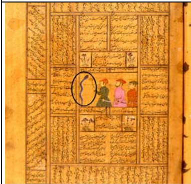
نگاره شماره ۱۲