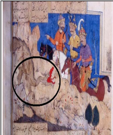
نگاره شماره ۱۰