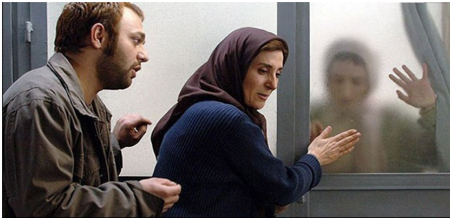
تصویر ۱: سینما بهمن، اکران اینجا بدون من ؛ حوزه هنری استان خوزستان