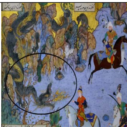
نگاره شماره ۵