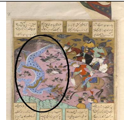
نگاره شماره ۱۱

با توجه به بررسی زمانی نگاره‌هایی با موضوع «آزمودن فریدون پسرانش را» که تاکنون به دست آمده، بیشترین تعداد نگاره‌ها به ترتیب در قرن ۱۶ و ۱۷ م (۱۰ و ۱۱ هـ. ق) ده نگاره، در قرن ۱۵ و ۱۶ م (۹ و ۱۰ هـ. ق) هشت نگاره، در قرن ۱۳ و ۱۴ م (۷ و ۸ هـ. ق) پنج نگاره، در قرن ۱۴ و ۱۵ م (۸ و ۹ هـ. ق) چهار نگاره و در قرن ۱۷ و ۱۸ م (۱۱ و ۱۲ هـ. ق) دو نگاره به تصویر کشیده شده است.