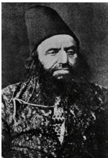
عطا شاه محلاتی آفاخان اول