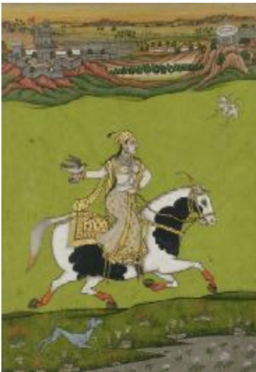
چاند بی بی سلطانه (پادشاه احمدنگر)