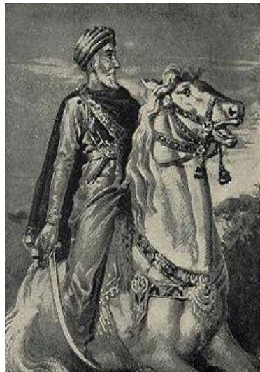
حسن صبّاح (پیشوای الموتیه)