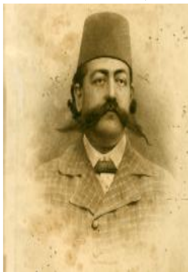
میرزا نصرالله خان فدایی اصفهانی