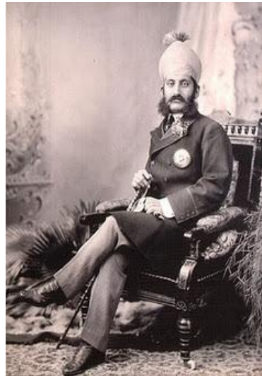
محبوب علي شاه نظام ششم