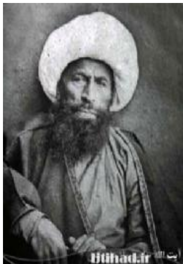
حاج ملا علی کنی مجتهد تهران