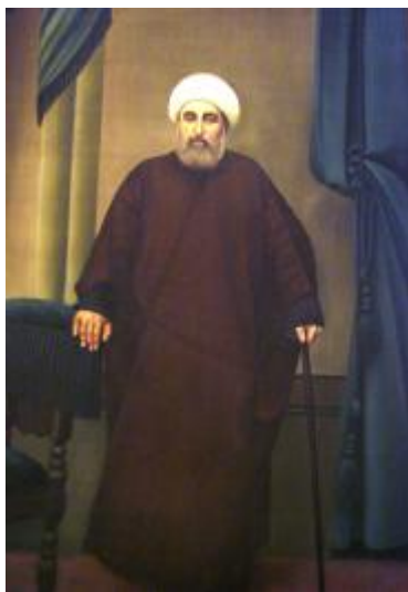
میرزا نصرالله اصفهانی ملک‌المتکلمین