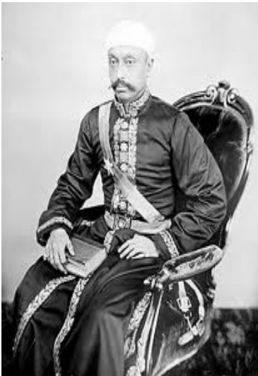
تراب علي خان معتمدالدوله