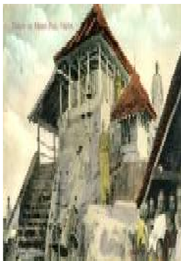
قدمگاه حضرت آدمؑ بر قلّه سرانديب