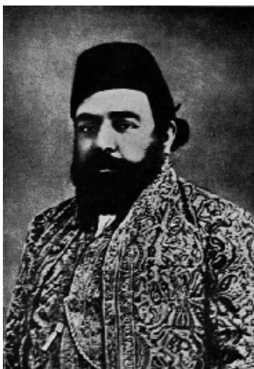
علی شاه آفاخان دوم