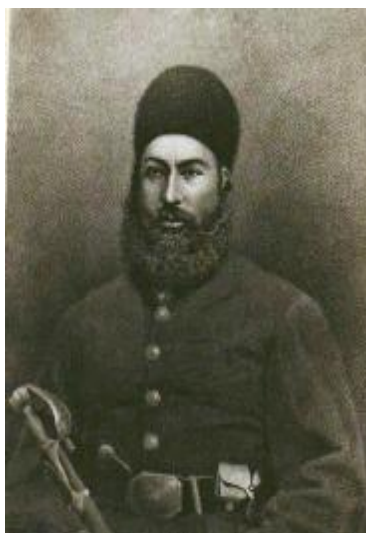
امیر عبدالرحمن خان بارکزی