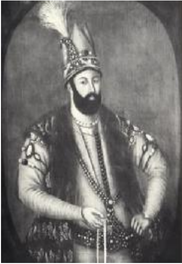
نادر شاه افشار