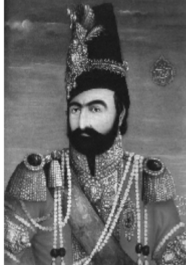
محمد شاه قاجار