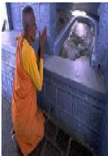
نقش قدم حضرت آدمؑ در سرانديب