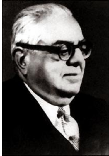
محمد شاه آقاخان سوم