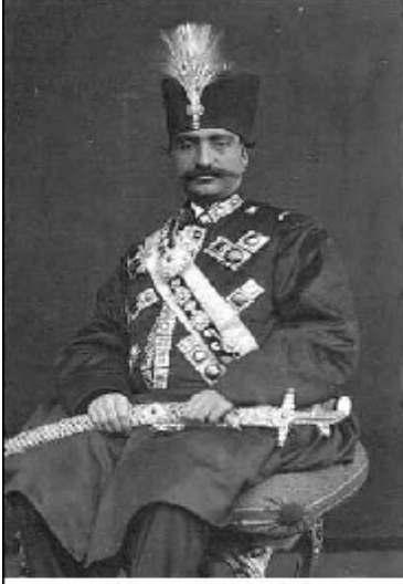
ناصرالدين شاه قاجار