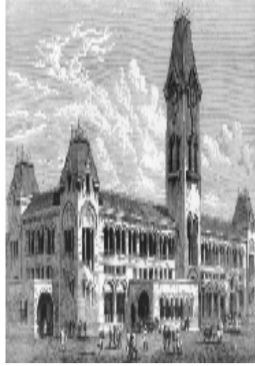
ایستگاه قطار مدرس ۱۸۸۰