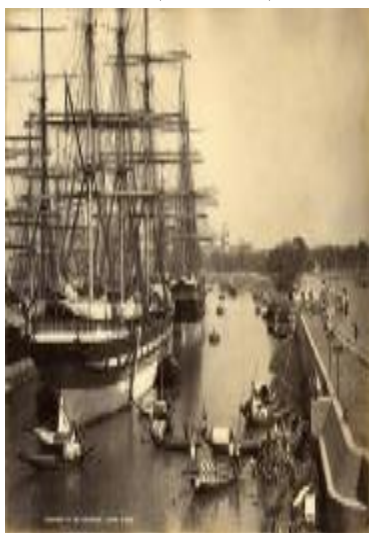
بندر کلکته ۱۸۸۰